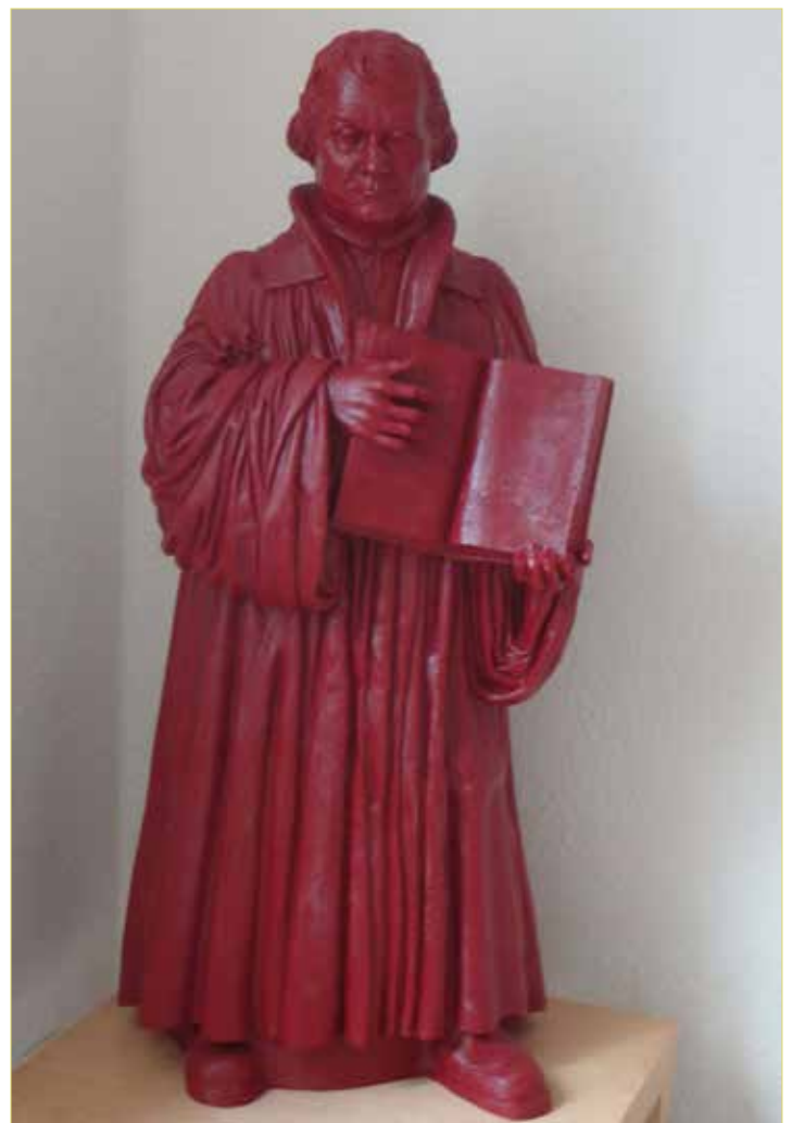
Statue von Martin Luther in Wittenberg