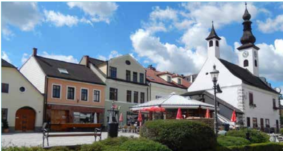
Gmünd - eine Stadt mit schönen Sgraffito-Häusern

Waldglashütte in Neu-Nagelberg, an. Leider war es uns wegen Umbauarbeiten des Ofens nicht möglich, die Glasbläser bei ihrer Arbeit zu beobachten. Der Firmeninhaber bemühte sich aber sehr, den Werdegang und den