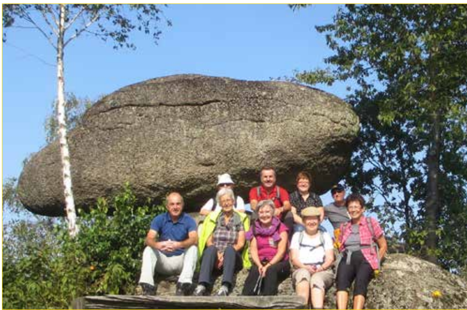
Redaktionsteam am Schwammerling